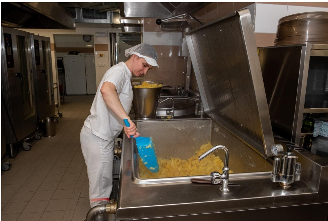
Nový kotel na školní jídelně Englišova 82

Zařízení školního stravování Opava, příspěvková organizace, Otická 2678/23, 746 01 Opava, IČO: 70999627