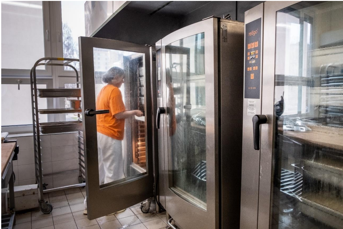
Nový konvektomat na školní jídelně Šrámkova 4

Zařízení školního stravování Opava, příspěvková organizace, Otická 2678/23, 746 01 Opava, IČO: 70999627