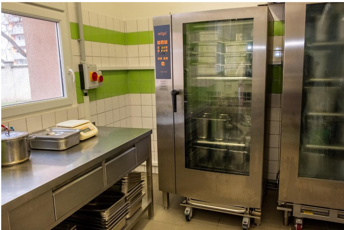
Nový konvektomat na školní jídelně Šrámkova 6