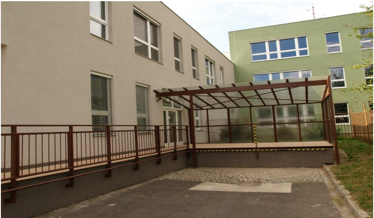
Oprava nákladové rampy Šrámkova 4