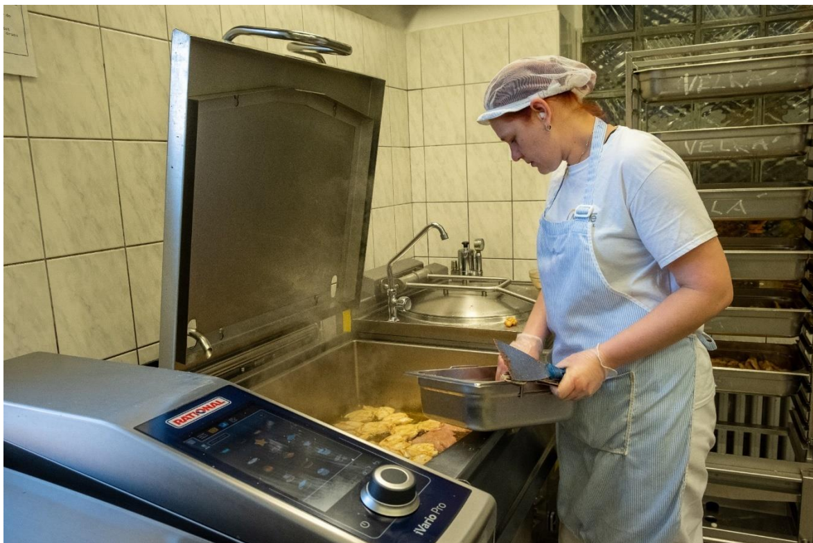
Školní jídelna Mařádkova 15- nová multifunkční pánev