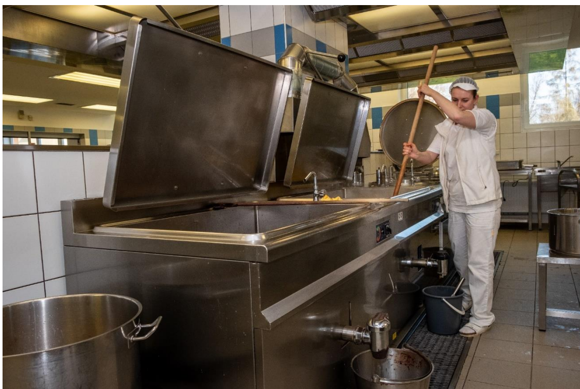
Nový kotel na školní jídelně E. Beneše 4